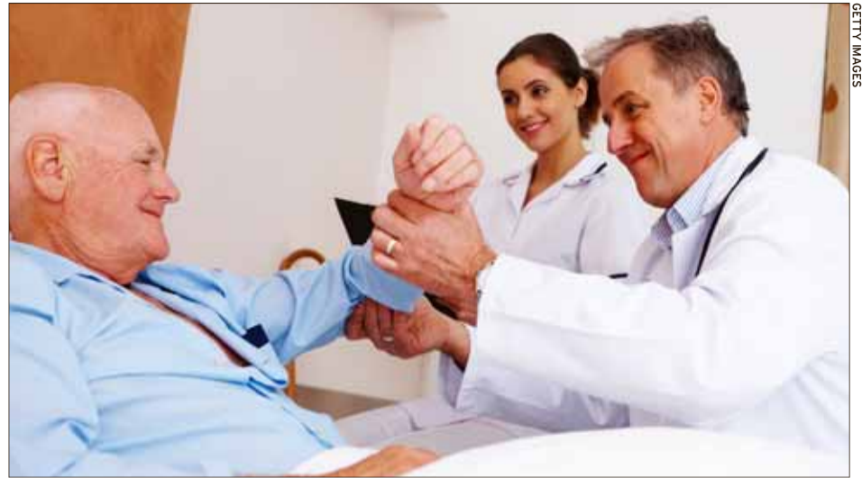
La buena atención al paciente en la asistencia sanitaria resulta fundamental.

Aunque el foco de la campaña son los profesionales sanitarios (entre los que no sólo se incluyen médicos, sino todas las personas que integran el ámbito sanitario), también pretende sensibilizar a organizaciones y a pacientes. Fernández indica las ventajas de que el núcleo organizativo sea multidisciplinar: "Son visiones distintas que se unen para hablar del mismo tema, y eso es alucinante, la verdad".